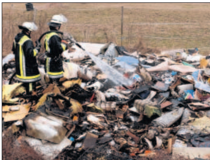
Ganz gut, dass Zeitungsbilder nicht „riechen“ können...

Bereits am Freitag waren sieben Einsatzkräfte bei einem schweren Verkehrsunfall auf Oberhausener Gemarkung, um die dortige Wehr bei der Rettung der Verunglückten zu unterstützen. Dieser Kreisgrenzen überschreitende Einsatz ist kam aufgrund der guten Zusammenarbeit zustande, Grundstein hierfür war die gemeinsame Waldbrandübung. ck